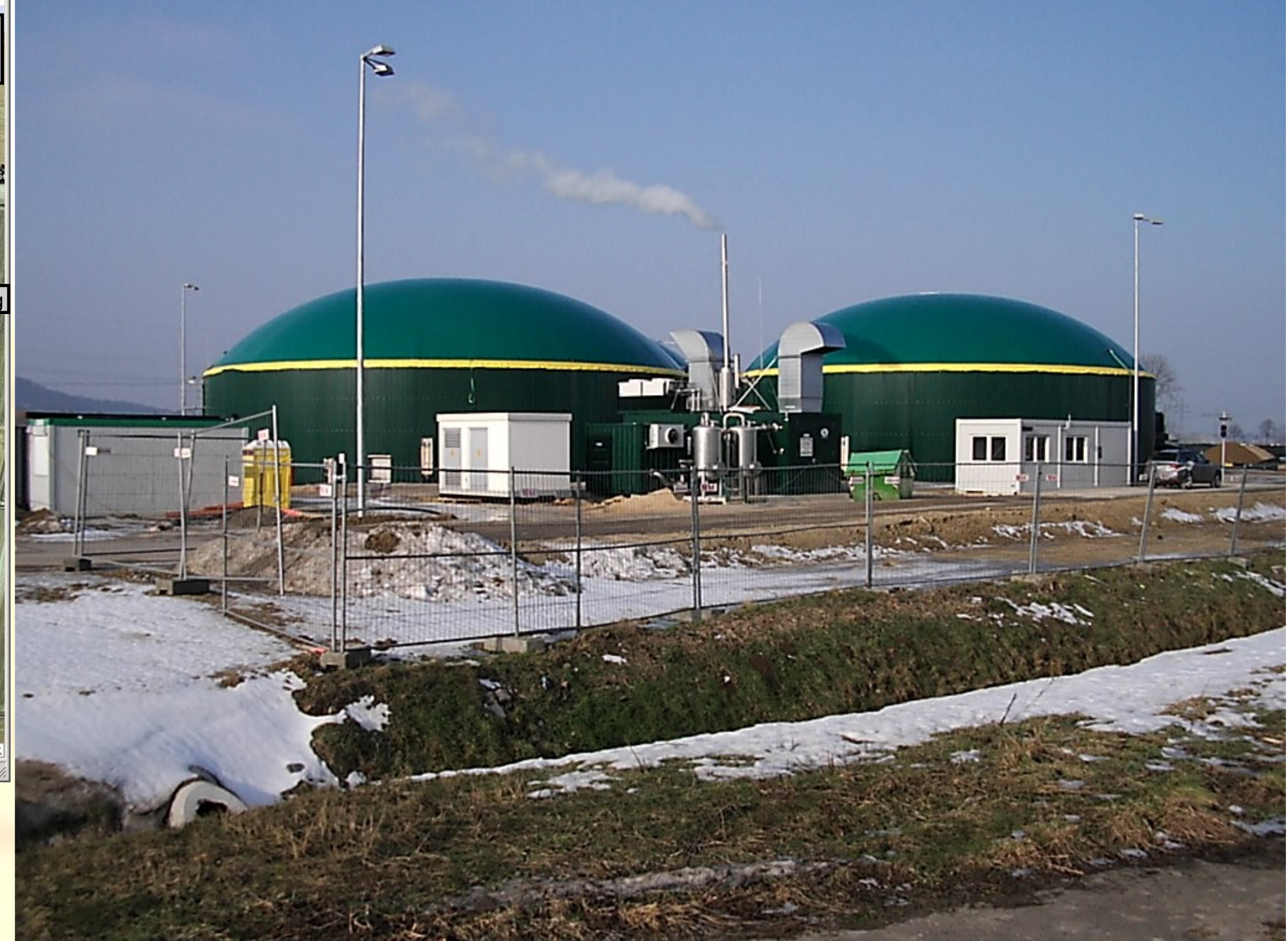
Das Biogas Satelliten-BHKW am Delfi-Bad

Seit Februar 2010 werden das Delfi-Bad und das Schulzentrum, mit Sporthalle und Jugendpavillon, von der Biogasanlage Gehrden beheizt.