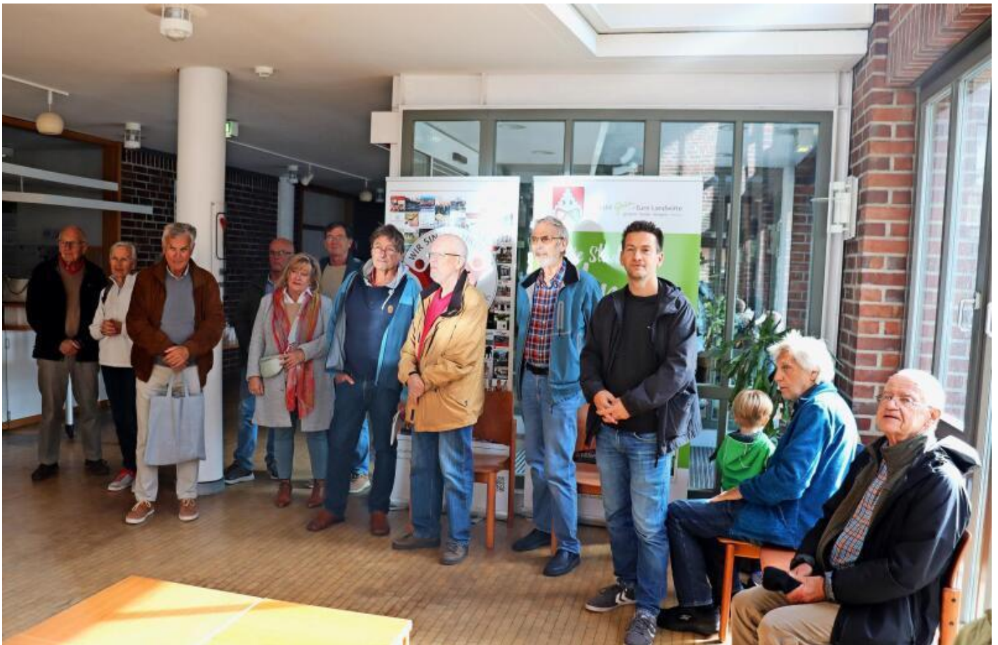
Feierstunde im Rathausfoyer: Rund 20 Gäste freuen sich über die Inbetriebnahme der 1.000. Solarstromanlage im Gehrdeener Stadtgebiet.

Laut Jansen macht Solarenergie in Gehrden rund 13 Prozent der lokalen Stromerzeugung aus. Mit dem gesamten Energiemix werde der Stromverbrauch Gehrden bilanziell inzwischen bereits zu 111 Prozent abgedeckt. Dabei sei die große Freiflächen-Solarstromanlage am Lemmier Bahnhof noch nicht einmal am Netz. Jansens persönliches Fazit: „Die Sonne schickt uns täglich zigfach mehr Energie, als wir verbrauchen können.“